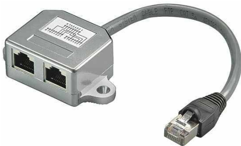
Schaltbild / Wiring diagram